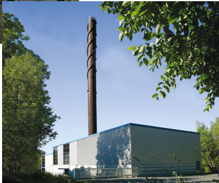
Vari Oy Kouvola, Kiskokadun lämpökeskus, 2003, 48 MW, öljysäiliö 500 m 3